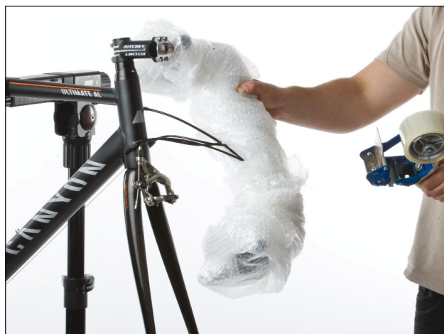
13. Der Lenker hängt jetzt nur noch an den Zügen und Bremsleitungen. Wickel den Lenker jetzt mit Luftpolsterfolie ein und fixiere ihn mit Klebeband.

ACHTUNG: Verdrehe den Lenker so wenig wie möglich. Die Züge und Bremsleitungen könnten sonst Schaden nehmen.