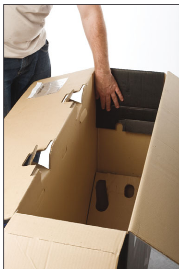
15. Falte die Klappe mit der Aussparung am Rand nach innen in den BikeGuard. Das ist die Seite, an der später die Front des Rennrades sitzt.