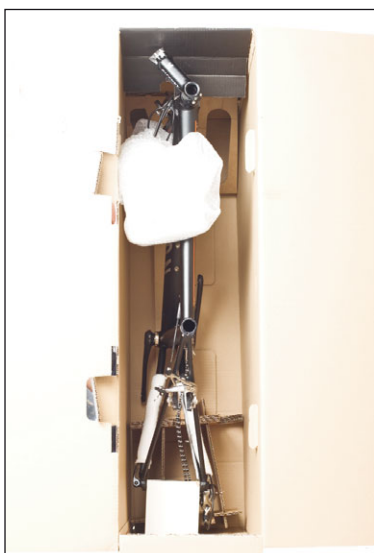
16. Packe den Rahmen nun in den BikeGuard. Die Gabel findet dabei in den Aussparungen der Kartonage Platz, der Hinterbau liegt mit dem Abstandhalter-Brettchen auf der hinteren Stützkartonage auf. Die Kette wird in die dafür vorgesehene Aussparung der inneren Kartonage gelegt.

ACHTUNG: Achte auf die Lage der Kette. Sie sollte keinesfalls unter die Kettenstrebe geführt werden, da es sonst zu Lackbeschädigungen kommen kann.