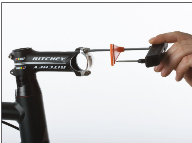
12. Ziehe die Vorbaukappe wieder fest, damit sie nicht verloren geht.