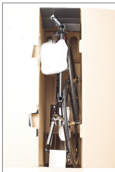
17. Packe jetzt erst das Hinterrad, dann das Vorderrad dazu. Das mit Schaumstoff geschützte Ritzelpaket des Hinterrades findet zwischen Sitz- und Kettenstreben im Hinterbaudreieck Platz.

ACHTUNG: Achte auf die Lage der Kette. Sie sollte keinesfalls unter die Kettenstrebe geführt werden, da es sonst zu Lackbeschädigungen kommen kann.