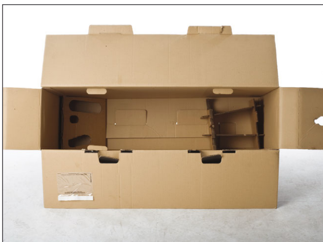
14. Das Rennrad ist nun bereit zum Einpacken, dazu musst Du jetzt nur noch den BikeGuard vorbereiten. Lege die beiden inneren Kartonagen so in den BikeGuard, wie es auf der Abbildung zu sehen ist.

ACHTUNG: Verdrehe den Lenker so wenig wie möglich. Die Züge und Bremsleitungen könnten sonst Schaden nehmen.